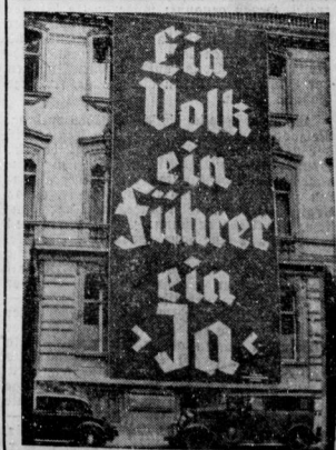
„Ein Volk, ein Führer, ein Ja.“ Am „Adolf-Hitler-Haus“, dem Sitz der Wahlleitung in der Vorstraße in Berlin, wurde dieses Wahlplakat für den 12. November, 1933.

Die Reichsregierung hat einen Schritt von ungeheurer Tragweite getan, weil sie überzeugt war, daß ein solcher Glaube im deutschen Volk hinter ihr stehe, und weil sie selbst von diesem Glauben erfüllt war. Sie hat ihn nicht an den Überbehauptung ihrer tatsächlichen Macht, sondern aus einem zweiten Glauben heraus, zu dem sie die höchste Befugnis hatte, aus dem Glauben an die Leistung eines Reiches es auch zwischen den Völkern. Denn irgend etwas aus dem großen Völkervertrag hervorgegangen war, was eine höhere sittliche Seite hätte bedeuten können, so war es die Idee des Völkervertrages. Denn ihm lag nach der ursprünglichen Bedeutung, die selbst ihre Heimat in Deutschland hatte, die Anerkennung eines Selbstverpflichtungsbundes der großen nationalen Lebensgemeinschaften zugrunde, der Gedanke also, daß den Kultur-