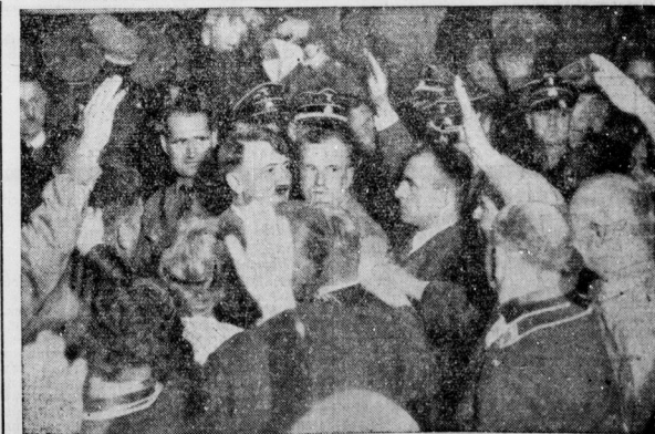
Münchener Gedenkstern der Vorkämpfer der nationalen Erhebung. Hitler begrüßt im Sternecker-Bräu seine alten Mitkämpfer.

Maria, ich will ein Mönch werden! Dieses doppelseitige Verhältnis zur Natur ist typisch deutsch. Luther war erfüllt von jenem heißen Sehnen, mit seinem Geiste den Dingen immer auf den Grund zu kommen. Denken, Fühlen und Wollen waren immer im heißen Ringen um das Letzte. Aber es war dieses, heilige Sehnenmischen bei ihm nicht eine Lust, geistlich zu sein. Er war weit davon entfernt, intellektuellen Sport zu treiben, sondern es ging ihm immer bei diesem Sehnen und Sehnen um die Wahrheit. Es war das, was wir das faulische Element an den Großen unseres Volkes nennen. Dieser Zug ist typisch deutsch. Luther hatte eine geradezu verblende Art, bei der einmal erkannten Wahrheit mit ehehemem Trost zu verharren. Er nicht und wankte nicht, folle es was es mochte. Darum verstanden ihn oft sogar seine nahen Freunde nicht, daß er sein Ziel so hartnäckig verfolgte. Ja, wäre es nur Hartnäckigkeit!