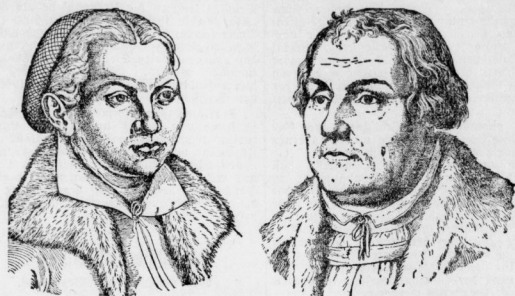
Dr. Martin Luther und Frau Käte.

Luther konnte zusehen mit der Hand auf den Tisch schlagen. Er konnte groß sein, eine Heilensseite, die von nichtdeutschen Menschen noch weniger begriffen wird.