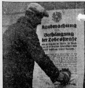
Der letzte Ausweg für Dollfuß. Da die Wiener Regierung der Unruhen nicht Herr werden kann, hat Dollfuß das Standrecht mit Todesstrafe verkündet.

Die Stimmberechtigten legen sich zusammen aus 43 928 663 Stimmberechtigten nach der Stimmliste plus 1 213 291 abgegebenen Stimmschichten. Die Zahl der abgegebenen Umschläge (einschl. der völlig leer abgegebenen Umschläge) belief sich auf 43 549 662.