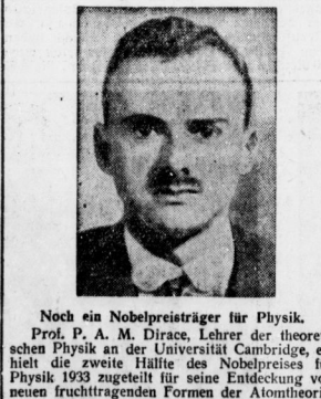
Noch ein Nobelpreisträger für Physik.