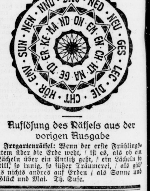
Auflösung des Rätsels aus der vorigen Ausgabe