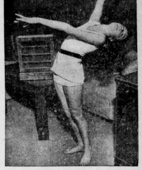
Morgenübungen vor dem Lautsprecher.