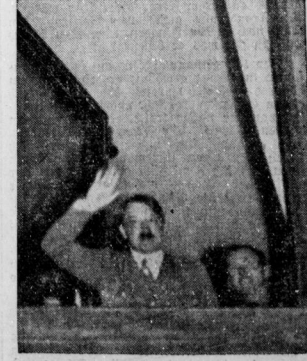
Bereits am Nachmittag des Wahlsonntags hatte sich eine große Menge vor der Reichskanzlei eingefunden, um den Führer zu sehen.