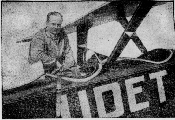
Die italienische Regierung hat das Anerbieten seinen Sportflugzeugen vom Flamingotyp der Hilfe zu kommen, darüber ausgenommen.