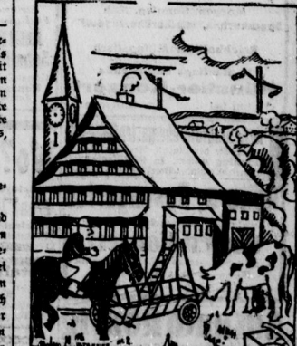
Auf diesem Bilde fehlen fünf wichtige Dinos. Welche?