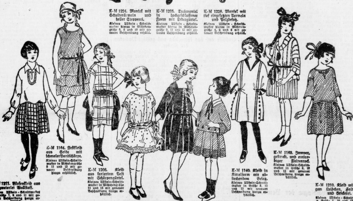
K-M 1164. Feffkleid aus Seide mit schmaler Bandbikörpe. Kleines Mädchen - Schnittmuster hierzu in Mädchen-größe 8, 11 und 13 mit genauer Beschreibung hierzu erhältlich.