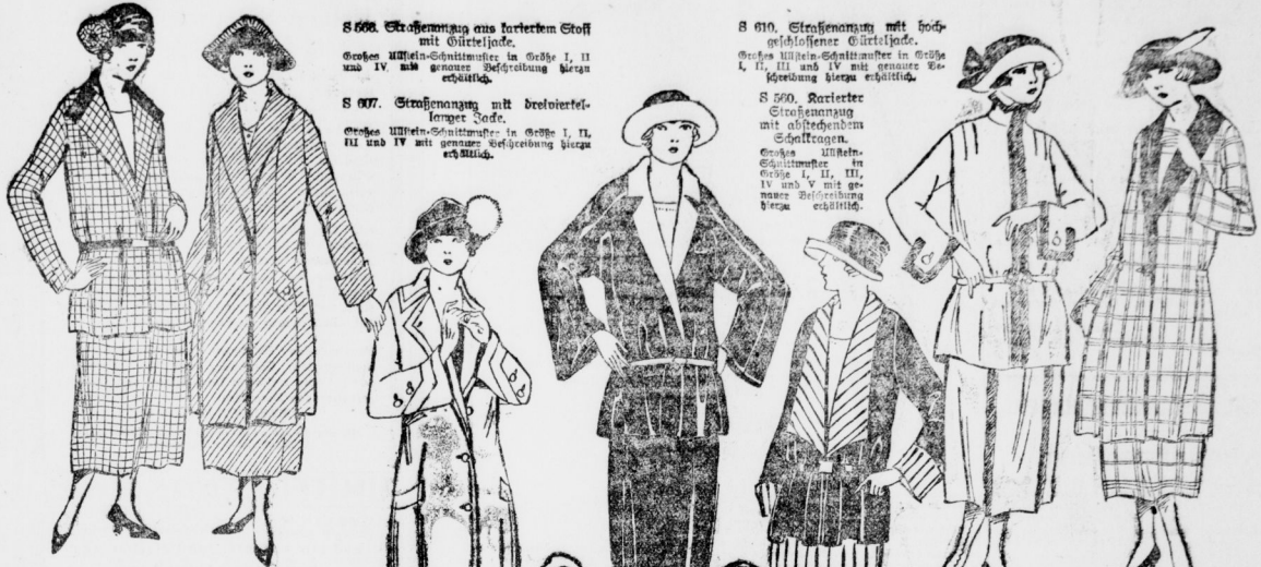
S 606. Straßenanzug aus kariertem Stoff mit Gürteljacke. Großes Ulstein-Schnittmuster in Größe I, II und IV mit genauer Befestigung hierzu erhältlich.