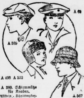
A 389 A 382

A 380. Schirmmütze für Knaben. Ulstein - Schirmmütze - Kleinformat in Aus- weisung 30, 34 und 38 mit genauer Beschreibung erhältlich.