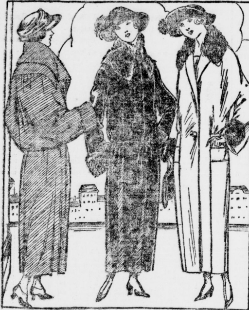
M 504. Gürtelloses Mantel in abgesetzter Form aus feinstem Flaumstoff mit langen Schalenbän. Großes Wolllein-Schnittmuster in Größe I, II und III hierzu mit genauer Befehrsung hierzu erhältlich.