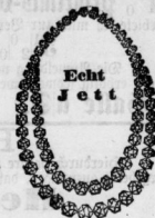
Freihlg. aus prima harten Jett nur 8 Mk.