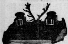
In grosser Auswahl zu 3 Mk. d. Stück