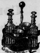
Sthellig m. f. geschliffenen Gläsern nur 3 Mk.