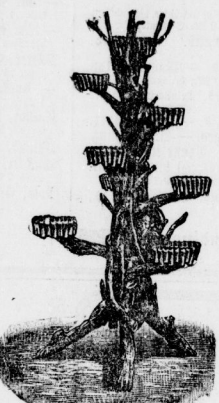
Blumen-Stecker 3 4 6 8 10 rechte 6 7 9 12 15

Große Weihnachts-Ausstellung hervorragender Neuheiten.