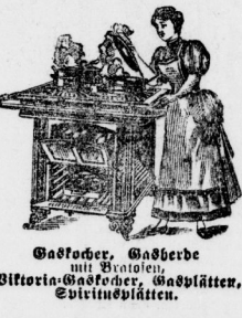
Gastgeber, Gaderbe mit Brotchen, Viktoria-Gastgeber, Gaderbatter, Evertinsplatten.