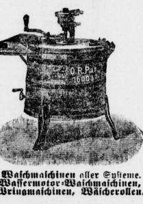
Waschmaschinen aller Systeme, Wassermotor-Waschmaschinen, Weingewinnmaschinen, Wäscherollen.