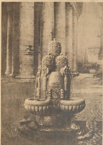
Der eigenartige Brunnen Roms. In der Nähe des Petriums wurde kürzlich ein neuer Brunnen eingeweiht, welcher die Form der päpstlichen Krone hat.