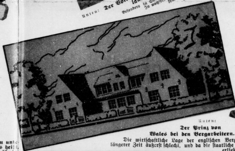
Der Wert von Wales bei den Bergarbeitern.

Die wirtschaftliche Lage der englischen Bergarbeiter ist seit längerer Zeit äußerst schlecht, und da die staatliche Hilfe nicht genügt, erließ der König von Wales einen Aufruf zu einer großen Sammlung zu Gunsten der notleidenden Arbeiter. Dieser Aufruf zeigt sich bei dem Kundgebung durch eines der lohnverbetreffenden Arbeiter.