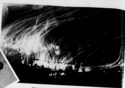
Feuerbrand eines Warenhauses. Bei dem Feuerbrand des Warenhauses liegt in der Schauffstraße in Berlin, entzündet durch den heftigen Sturm ein gefährlicher Funkenflug, der die ganze Umgebung in Rauch und Asche versetzt. Hier wird gezeigt eine schauerlich schöne Aufnahme des Feuerregens.