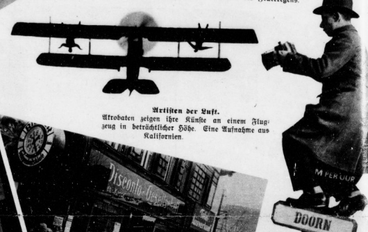
Metieren der Luft. Kroketen zeigen ihre Künfte an einem Flugzeug in beträchtlicher Höhe. Eine Aufnahme aus Kalifornien.