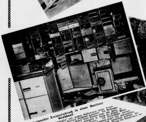
Reinigungs- und Zentralfach in einer Berliner Reinigungs- und Zentralfach in einer Berliner