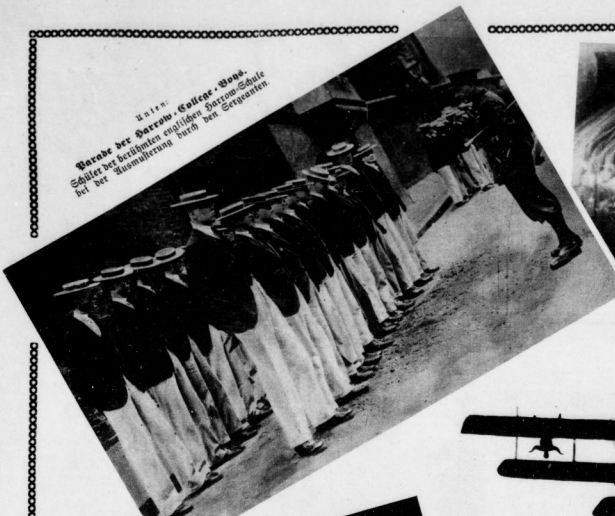
Wache der Barrow-Garde - Bawa. Schüler der fraglichen englischen Barrow-Schule bei der Ausmählung durch den Gouverneur.