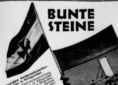
Die dreifache Heiligenschein. Schatten in Klingen und Im Bayern des Schloß der Scherung Wesend Jones, London in Erinnerung im Grange die würdigen Hart, General Schatten der Kolonnen, Hart, General des Schloß am 25. von Waterloo den Sold auf dem Hügel.