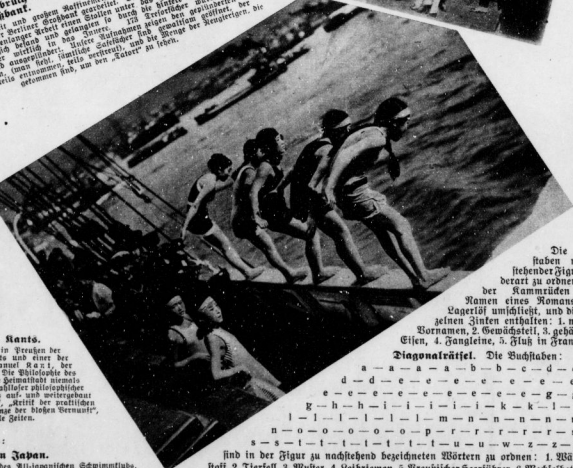
Transport in Japan.