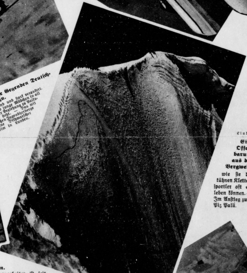
Eine Erfen- barung aus der Bergwelt, wie sie die fühnen Kletter- sportler oft er- leben können. — Im Kauting am Fuß Patia.