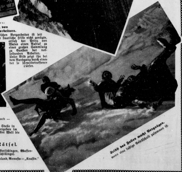
Zeit des Ratten macht Bergsteigen. wenn eine tüchtige Gesellschaft zusammen ist.

Metaphor: Kolonnen, Nomaden, Winterton, Sonnabend, Sonate, Inland, Nemeis = „Krajin“ Metaphor: Kolonnen, Nomaden, Winterton, Sonnabend, Sonate, Inland, Nemeis = „Krajin“ Metaphor: Kolonnen, Nomaden, Winterton, Sonnabend, Sonate, Inland, Nemeis = „Krajin“