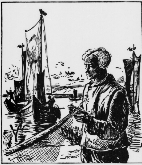
Fischer an der Kurischen Nehrung

In diesem Jahr geht's im Urlaub an die See