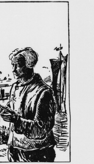
Golzschmitt von Reimisch (Garten-Bl.)

In diesem Jahr geht's im Urlaub an die See