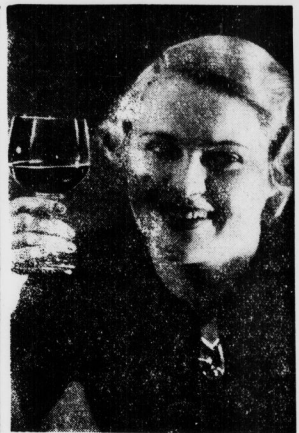
Ein Prosit dem neuen Jahrgang!

stellen, jedenfalls fand man von seiner Firma herausgegebene Anweisungen für Reisende vor, wie sie am besten seine „Nährstoffzusatz-Pflanzung“ den Reuten aufzubewahren sollten. Saupflanze war, den offenden Frauen unbedingt logisch in die Wohnung folgen, wenn er ein Gläschen verlangte, um ihnen eine Kostprobe anzubieten. Sollte die Frau etwa den Reisenden vor der Tür warten lassen, dann sollte er sich Stolz erklären: „Ich bin kein Bettler, ich schenke Ihnen was. Ihre Nachbarin wartet schon auf mich.“ An der Tür würde nämlich doch seine Frau einen Bestellschein auf die Kurpackung unterbreiten.