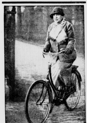
Die Königin radelt

Der Australier trieb uns vor sich. Das flinke Greenhorn liefen wir bei den Kamelen im Vorne. Mit dem einfachen Handwerkzeug aller Goldfledschern streunten wir über den Sand. Nach einer Stunde angedampften Störrens auf die gelbe Fläche tauchte der Führer seine Axt in das Glanzmermal und hob ein funkelndes Nödrchen von Eisenadelforsparde! Bald kamen auch wir in Uebung und benannten uns „ernten“. Pflüchten