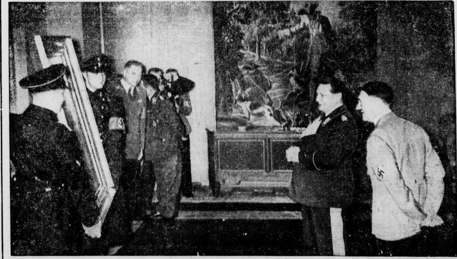
Als Geburtstagsgeschenk überreichte der Führer Hermann Göring ein großes Gemälde. Unser Bild zeigt Adolf Hitler mit Hermann Göring bei der Betrachtung des Geschenks.