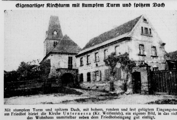
Eigenartiger Kirchturm mit stumpfem Turm und spitzem Dach. Mit stumpfem Turm und spitzem Dach, mit hohem, rundem und fest gefügtem Eingangsturm am Friedhof bietet die Kirche Unterressa (K. Weissenfels), ein eigenes Bild, in das sich das Wohnhaus unmittelbar neben dem Friedhofseingang gut einfügt.

Nierburg (Altmark). „Mimi“, die vierbeinige Darstellerin des „Stappenhafen“, der vom Altmarkischen Landesheiter in Nierburg aufgeführt wurde, hatte dadurch von sich reden gemacht, daß sie dem Entwickeln nach Zählort der Vorrichtung ausgereicht war. Aber sie hat sich ihrer Arbeit nicht angeerkennen können. Im Museum in die Freiheit endete in einer Kautzengasse in Nierburg. Die Aussteuerin konnte dem Altmarkischen Landesheiter wieder zurückgegeben werden.