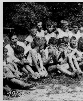
Auch in den Kinderheimen der NS-Volkswohlfahrt können Kinderpflegerinnen und Kinderwärterinnen mitarbeiten...