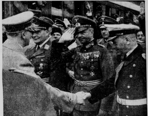
Der Führer verabschiedet sich von den Oberbefehlshabern der 3 Wehrmachtsteile

Die Reise des Führers nach Italien findet in Neugort die größte Beachtung. Bereits seit mehreren Tagen bildet sie den Gegenstand ausführlicher Presseberichte. Die „Neugort Times“ erklärt in einem Leitartikel, die Delegation, die den Führer begleite, sei wohl eine der bedeutendsten, die Deutschland je verlassen habe.