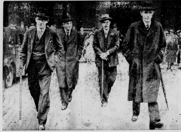
Die Winterberatungen in London

Der Kleinriegel in Palästina geht stot weiter. Haben die Briten an der einen Stelle auf der ihnen eigenmächtigen Weise der Entvölkerung ganzer Gemeinden die Rüge wiederholt, so wird sie in einem anderen Winkel Palästinas um so heftiger geführt.