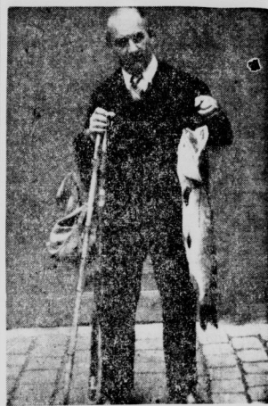
Der glückliche Angler mit der Beute.

Nobbe bei Gröbers. Einige Freunde des Angelfisports aus Halle fingen in dem Teich einer ehemaligen Ziegelei, in dem sich viele