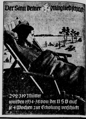
Der Sinn Deiner Mühseligkeit

Rangeneckstadt. (Tauben Hogen) In der Nähe von Rangeneckstadt... Rangeneckstadt. (Tauben Hogen)