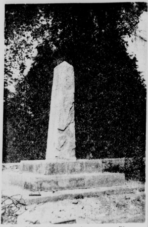
Der Meilenstein auf seinem neuen Platz.

Vor ungefähr 25 Jahren brachte die durch den Krieg eingegangene... Apfelschurz wird Wahrheit