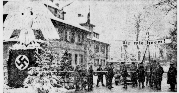
Hübsche Aufnahme von der nun endlich fallenden unsinnigen Saargrenze.

An Reichsleiter Alfred Rosenberg, der ebenfalls am Sonnabend seinen Geburts-