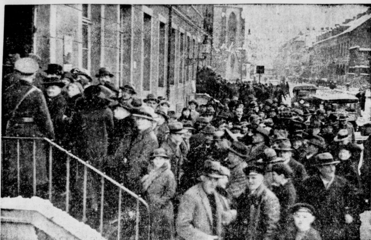
Der Andrang war so groß, daß die Abstimmenden Schlange stehen mußten.

Grenzüberschreitung in Deutschland festgenommen worden waren, machte auf die laarländische Arbeiterjugend harter Einbruch. Eine Maßnahme des Reichsausschusses zur Durchführung der Sonntagverbreitung und Vertrieb sämtlicher periodischer und nicht-periodischer Druckschriften, soweit sie im Saargebiet erdienen, verboten wurden, stellte sich als einseitige Maßnahme gegen die Sonntagsausgaben der Zeitungen der Deutschen Front dar. Auf das Verbot hin erließen am Sonntagabend noch eine Ausgabe der „Saarbrücker Zeitung“ und der „Landbesetzung“.