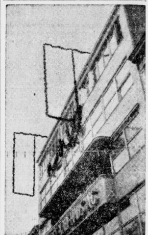
Fahren waren verboten! „Baggie“ Saarbrücken mit Girlanden in Fahnenform.

Grenzüberschreitung in Deutschland festgenommen worden waren, machte auf die laarländische Arbeiterjugend harter Einbruch. Eine Maßnahme des Reichsausschusses zur Durchführung der Sonntagverbreitung und Vertrieb sämtlicher periodischer und nicht-periodischer Druckschriften, soweit sie im Saargebiet erdienen, verboten wurden, stellte sich als einseitige Maßnahme gegen die Sonntagsausgaben der Zeitungen der Deutschen Front dar. Auf das Verbot hin erließen am Sonntagabend noch eine Ausgabe der „Saarbrücker Zeitung“ und der „Landbesetzung“.