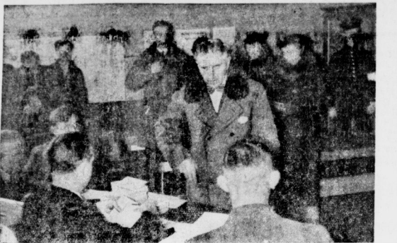
Der Sondergesandte in Wien v. Papen gibt seine Stimme ab.