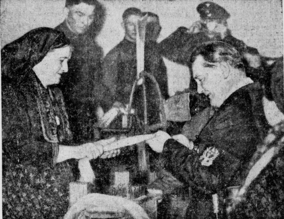
General Göring bei der Ausstellung der Flachspsinnerinnen. Während des Rundganges durch die Ausstellung der Grünen Woche in Berlin blieb der Preußische Ministerpräsident General Göring auch vor den Flachspsinnerinnen stehen, wo er sich etwas von ihrer Tätigkeit erzählen ließ.

Vordartwood über seinen Berliner Besuch. Der Sondervertreter des "Daily Telegraph" berichtet über eine Unterrednung, die er mit Lord Allen of Liverpool nach dessen Rückkehr aus Berlin hatte. Dem Bericht zufolge sah Lord Allen den Gesamt eindruck seiner Beziehungen folgendermaßen zusammen: „Deutschland wünscht vornehmlich lebensfähig den Frieden.“