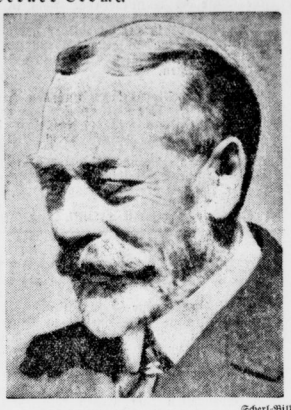
König Georg von England.

Das englische Volk rühmt sich zum fünften Regierungsjubiläum seines Königspaares. Es soll ein Fest werden, wie man es im Gedächtnis jeder Generation nicht mehr erlebt hat, und in den drei Monaten vom Mai bis zum Juli soll alles gefeiert werden, was Alt-England noch an Macht und Glanz und Erinnerungen an seine große, ruhmvolle Vergangenheit aufzuweisen hat.