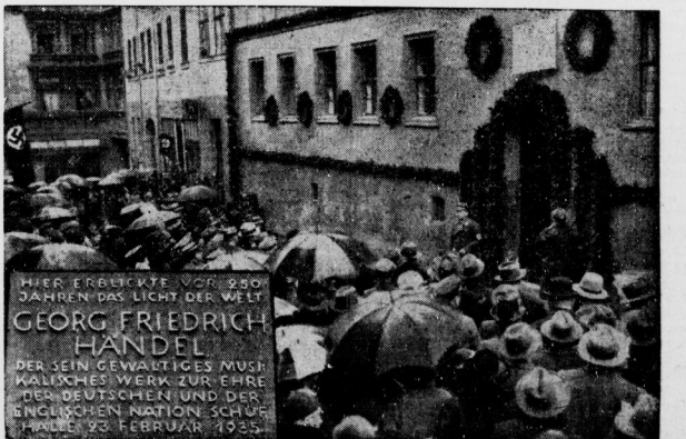
Entüllung der Gedenktafel am Handel-Haus (linke Ecke: die Tafel mit Inschrift).