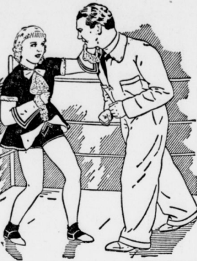
Anny Ondra und Max Schmeling in dem Tonfilm „Ein junges Mädchen — ein junger Mann“