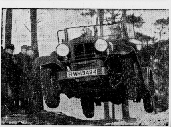
Ein originales Bild von der Orientierungslauf... die Verhandlungen nunmehr zu einem

Er nimmt die... die Verhandlungen nunmehr zu einem