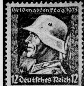
12 Deutsches Reich 12