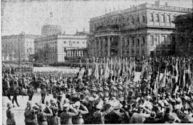
80 Fahnen der alten Armee ziehen im Parademarsch an dem Führer vor dem Ehrenmal vorbei. Nach der Kranzniederlegung an Ehrenmal Unter den Linden fand der Vorbeimarsch der verschiedenen Ehrenabteilungen der Wehrmacht vor dem Führer statt. Unser Bild zeigt die alten ruhmbedeckten Fahnen, die hier am Führer vorübergetragen wurden.

Unter diesen Umständen sah sich die deutsche Regierung veranlaßt, vor sich aus jene notwendigen Maßnahmen zu treffen, die eine Vereinbarung des eben unwirksamen wie letzten Endes beherrschten Zustandes der absmächtigen Wehrlosigkeit eines großen Volkes und Reiches gewährleisten konnte. Sie ging dabei von denselben Ermäugungen aus, denen Minister Baldwin in seiner letzten Rede im letzten Ausbruch verließ: „Ein Land, das nicht gewillt ist, die notwendigen Vorstöße