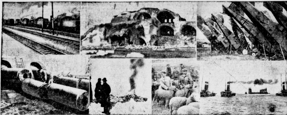
Unsere Erfüllung nach Versailles. Oben (von links nach rechts): abzuliefernde Lokomotiven in Trier; gesprengte Festungswerke in Küstrin; alle Flugzeuge wurden vernichtet. Unten: zerstörte Geschütze auf Helgoland; Verbrennung von Militärpässen und Stammrollen; das verhungerte Deutschland muß Vieh abliefern; Abtransport von Schwimmdocks nach Frankreich.