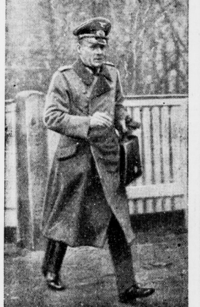
Der Chef des Generalstabs des Heeres

Ein fesselndes Bild von der amerikanischen Luftflotte. Es zeigt einen neuen Kampfeindecker, der mit vier Maschinengewehren bewaffnet ist und als Bombenladung „Bombenbündel“ mit sich führt, die von dem Flugzeug zusammen abgeworfen werden. Die Amerikaner nennen diese „Bombenbündel“ Todesopten.