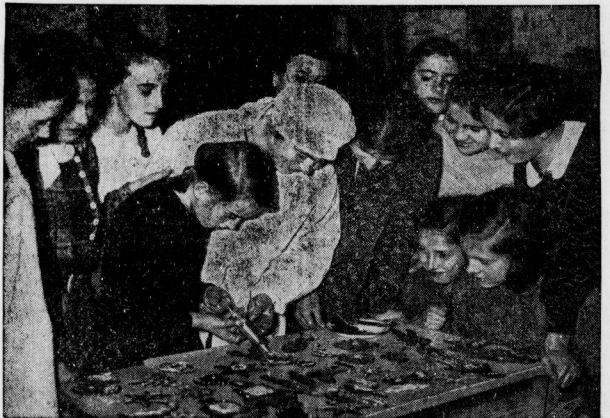
Junge Mädchen backen für Weihnachten.

Wenn dann alles geklappt hat, dann stehen am Deutschen Alles auch tausende von Kilo- metern von Halle entfernt hallesche Christ-