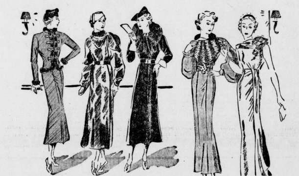
Links: Ein flottes Trenchkostüm mit Pelzverandung und Pelzamentenschmuck. Daneben ein Pelzmantel aus Nutria in weiler, gezierter Form mit feinsten Krawatte. Für den Nachmittag ist der dunkle Mantel mit aufgesetztem Pelzhaarkragen besonders praktisch; der Kragen endet laborterr. Rechts: ein hübsches Trenchkostüm, an dem die reiche Stoffverarbeitung und der Pelzverandung besonders bemerkenswert sind, und ferner ein Abendkleid mit einseitiger Halsung und geschmackvoller Blumengirlande. (Zeichn. Hildgauer - Scherl-W.)