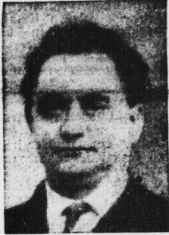
Dimitroff Chef der Komintern.

Ueber die Scharnherrschaft der Marxisten in Malaga berichtet der Sonderreporter