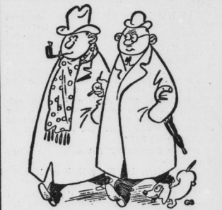
„Wissen Sie eigentlich, Herr Meyer, daß Ihre Frau allein Meinen erzählt, daß Sie gar nicht zueinander passen?“

„Am! Das stimmt wohl!“ gab der Winzer zu. „Aber mit will scheinen, als ob Sie die wirtschaftlichen Verhältnisse etwas zu sehr durcheinander werfen? Erzeugen ist nicht dasselbe wie befördern, lagern, handeln, vertreiben und verkaufen!“