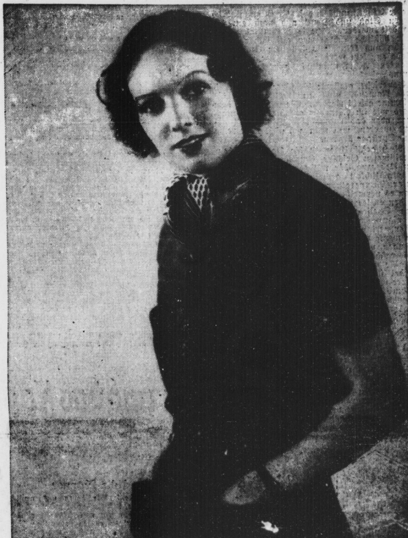
Inge etwas allein...

„Nicht zuletzt wird der Preis der Nahrungsmittel in der einzelnen Gegend bei der Mengehaltung ein gewichtiges Wort mitzusprechen“, betont Professor Reiter. „Was nützen der Hausfrau die besten gefundheitsvollen Rat- und Vorschläge, wenn sie die betreffenden Speisen von dem Wochenlohn des Mannes nicht betreiben kann. Man muß also genau wissen, was in dem fraglichen Land- und in jeder Jahreszeit reichlich und billig zu haben ist. Dann wollen die einzelnen Nahrungsmittel auf ihren Nährwert geprüft sein und auch darauf, wie sie in einer Mahlzeit zusammenkommen. Nur so kann man teurere gegen billigere, aber gleichwertige, austauschen, z. B. Fleisch durch Quarkgerichte, die gleichen Eiweißgehalt haben, ersetzen, nur so auch verhindern, daß sich die einzelnen Nahrungsmittel in ihrer Wirkung im Körper gegeneinander bekämpfen, denn auch durch falsche Zusammenlegung einer Mahlzeit kann man verschenden! — Ein erster Versuch, aus exakten ernährungswissenschaftlichen Beobachtungen die Ergebnisse für einen wichtigen Bezirk auszuwerten, ist von dem Kaiser-Wilhelm-Institut für Arbeitsphysiologie“ in Dortmund unter Mitwirkung des Reichsgesundheitsamtes für das rheinisch-westfälische Industriegebiet mit einem Kochbuch gemacht worden, das kürzlich bei Chr. Kaiser in München erschien. Wir hoffen, daß bald auch für andere Teile des Reiches solche wertvollen Anleitungen für die Hausfrau herausgegeben werden.“