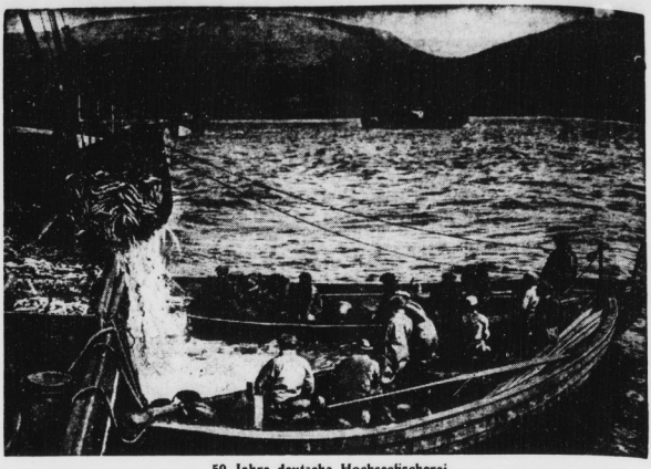
50 Jahre deutsche Hochseefischer. 350 deutsche Fischdampfer fahren auf der Meeren, und rund 100 000 Menschen finden in diesem harten Beruf ihren Lebensunterhalt. Hier sieht man Fischer bei der Arbeit an der Küste von Island.

Neue Räume für Berufs- und Handelsschule. Blankenburg (Harz). Die Stadt Blankenburg hat die Gebäude der ehemaligen, nach Kriegsende verlegten Tischlereischule für eine fächliche Berufsschule und die Handelsschule unterstellt. Mit dem Kauf der Gebäude der früheren Tischlereischule, die die Stadt die großen Raumverhältnisse in der Verbandschule und die Unterrichtsfrage der neuen Handelsschule gelöst und die alte Fachschule ihren Schulzwecken wieder angepasst. Nach der Erneuerung der Räume und der Schaffung eines Schulhofes wird der Unterricht aufgenommen.