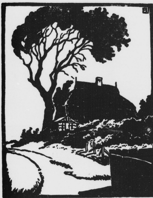
Haus auf der Höhe