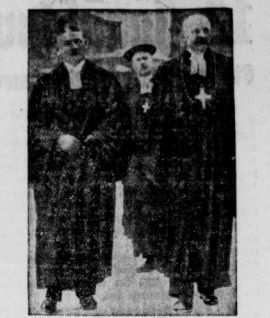
Die Amtseinführung Bischof Peters. Unser Bild zeigt die Geistlichen auf dem Wege zum Dom; von links: Bischof Peter und Reichsbischof Müller.

Desau. Das anhaltische Staatsministerium hat Ergänzungsbestimmungen über die Dienstverhältnisse der Gemeindepolizeibeamten und für die in den Gemeindefunktion überretenden Schutzpolizeibeamten. Danach kann ein derartiger Beamter auf eigenen Antrag oder aus dienstlichen Gründen von einer Gemeinde in eine andere versetzt werden. Die anhaltische Gemeinde muß den Beamten mit seinem bisherigen Dienstort weiter beschäftigen. Hat der Beamte das 40. Lebensjahr bereits überschritten, so muß die abgehende Gemeinde bei der späteren Pensionierung den Anteil bis zur Versetzung in eine andere Gemeinde an die aufnehmende Gemeinde zahlen. Ist der Beamte jünger, so hat die aufnehmende Gemeinde die Pensions- und Hinterbliebenenrenten allein zu tragen.