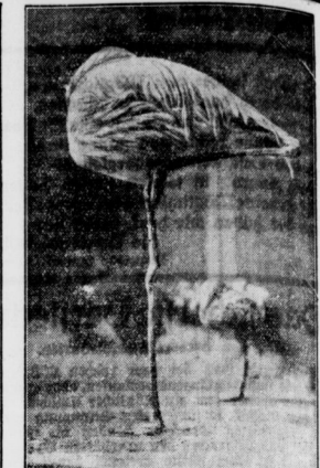
Seine beamtete Puchstellung. Schlafender Flamingo im Zoologischen Garten.

In Norddeutschland ist heute noch die Sitte heimisch, das sich morgens Burden und Mädchen aneinander überreichen und mit einem Namen "Bewegenhäubung" d. h. die Hebe oder Dats, die "Schläferin", weden; und die Gabe nannte man "Beweden".