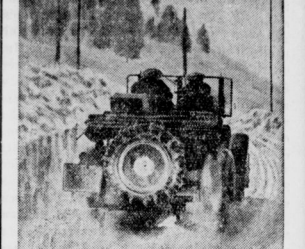
Kraftfahrzeugh-Winterwerb des NSKK und DDAC. Auf verschneiten Wegen nach Oberstaufen.