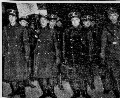
Faschistisches Orchester auf Konzertreise durch Deutschland. Die 75 Mann starke Banda Fascista des Dopolavoro spielt auf ihrer Deutschlandreise morgen in Halle.

Mit neuen Kräften, in denen der Gauselgeschäftsführer ein Demutis eblicher Zusammenarbeit sieht, teilt sich der Verfasser ebenfalls auseinander. Walter Fieher erblickt sie in den unentwegten Anhängern Luederbergs und in den sogenannten Kahlereuten, die gegen den nationalsozialistischen Front einseitig seien und durch ihre Willkür immer wieder einen Keil zwischen graue und braune Front treiben. Mit diesen Kreisen und Kräften geht er streng ins Gericht, indem er sie der Schuld