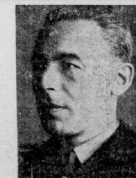
Walther Beumelburg: der bisherige Intendant des Südwestdeutschen Rundfunks, wurde, wie bereits gemeldet, an Stelle des Intendanten Friedrich Arendhövel, der um Enthebung von seinem Amt bat, zum Intendanten bestellt.