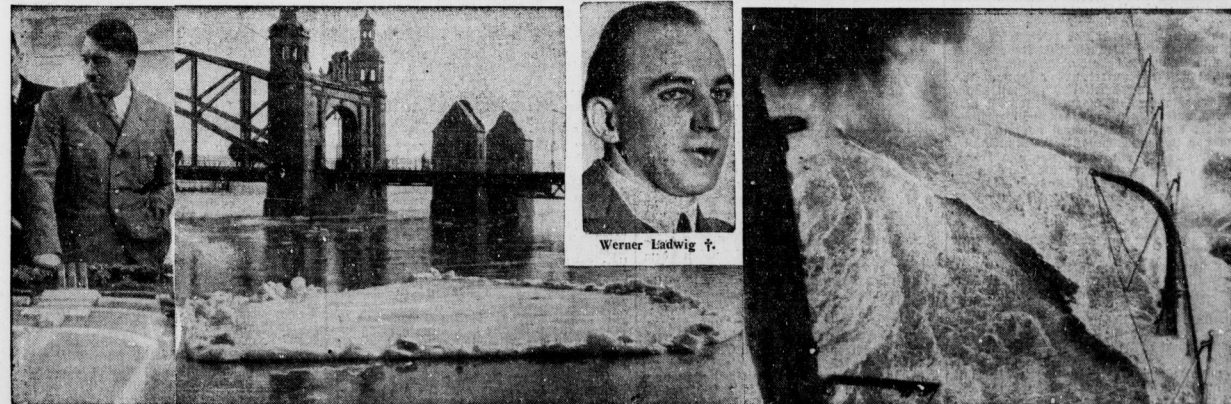
Der Führer vor dem Modell. Auch im östlichsten Winkel des Reiches weicht der Winter. Sturm zwang Englands Kriegsschiffe zum Manöverabbruch. Die Panzerkreuzer „Hood“ im schneeigen Seegang. Gewaltige See geht über Bord.

Der zweite Teil des Gesetzes befaßt sich mit der Erhebung von Spenden, die in Zukunft der Genehmigung des Stellvertreters des Führers der NSDAP. im Einvernehmen mit dem Reichsstatinminister bedarf. Der dritte Teil enthält Bestimmungen über die Abgabe der Arbeitslosenhilfe, wonach eine wesentliche Verrückung in der Abgabepflicht bzw. eine völlige Befreiung von der Abgabe eintritt. Ferner genehmigte das Reichsstatineft ein Gesetz zur Änderung des Kraftfahrzeugsteuergesetzes, wonach Steuerermäßigungen bzw. Steuerbefreiungen für Kraftfahrzeuge aus dem Ausland fellekt werden, um den Fremdenverkehr zu fördern. Das Gesetz über die Erhebung einer Abgabe der Aufsichtsratsmitglieder schafft eine neue Belastung, sondern bleibt lediglich die bisher unter der Bezeichnung „Aufschläge der Aufsichtsratsmitglieder“ bestehende Sonderbelastung auf die Zeit nach dem 31. März 1934 aus. Das Gesetz über die Bildung eines Anleihenbundes der Kapitalgesellschaften bestimmt, daß bei Ausschüttung von 6 v. H. und mehr der gegenüber dem Vorjahr erzielte Mehrbetrag in Anleihen des Reiches, der Länder