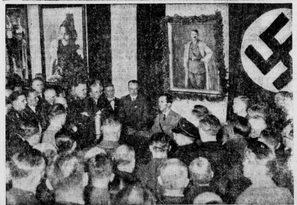
Die Eröffnung der Fremdeverkehr- Werbezentrale „Deutschland“.

Die Forderungen der Frontkämpfer. Bei Ministerpräsident Doumergue erschien eine Abordnung der französischen Frontkämpfer, um ihm zu erklären, daß die Frontkämpfer auf keinen Fall eine Ermäßigung ihrer Renten annehmen würden. Da auch die Heimwehrenorganisationen gegen die Kürzung der Renten erklärten, protestierten, andererseits aber vier Milliarden eingezahlt werden müssen, ist die Situation der Regierung äußerst heikel. Obwohl Doumergue in seiner Antwort auf die Frontkämpfer durchdrillend lieh, daß er zurücktreten würde, falls sein Appell an die Späterreichlichkeit der letzten Frontkämpfer erfolglos bleibe, haben die Frontkämpfer auf ihren Widerstand beharrt. Die Regierung Doumergue wird sich daher früher oder später vor eine außerordentlich schwierige Entscheidung stellen müssen. Die von Doumergue angekündigte Deflationspolitik wird jedenfalls nur zu einem Teil das Budgetdefizit decken können, der Rest muß durch eine Kürzung der Beamtengehälter und Frontkämpferrenten bestritten werden. Welche Transformationen sich aus dieser Lage, ihre Rechte auch durch direkte Aufhebung gegen die Regierung zu verteidigen. Wenn Doumergue nach Hause geht, sind die Folgen für die französische Innenpolitik unabsehbar.