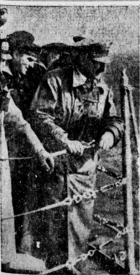
Der Führer an Bord der „Deutschland“.

Zwischen ist es gestern im Raum zwischen den Randgebieten des Harzes und der Heidegebiete zu ersten Frühlingsgewittern gekommen, die allerdings kaum über nur sehr geringe Niederschläge zur Folge hatten, sich vielmehr zunächst auf mehr oder minder starke elektrische Entladungen beschränkten. Leider hat ein am Dienstagmorgen in der Gegend von Weipitz niedergeschlagener Gewitterkegel sich gegen die südliche Landwirtschafsstation Ernst Wader in Wormsborn bei Eisleben,