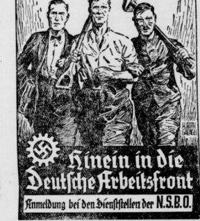
Anmeldung bei den Dienststellen der NSD.O.