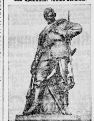
Am 18. April 1864 sprengte der Pionier Karl Klinker unter Einsatz seines Lebens die Palladen von Schanze 2 der Düppeler Schanzen...