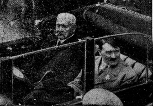
Hindenburg und Hitler am Tag der Arbeit im Vorjahre.

Ein Schiffsaufammenstoß, der leicht ernste Folgen hätte haben können, ereignete sich im Bereich der deutschen Eisenbahnfähre Kronprinzessin Luise wurde von einem englischen Kohlendampfer gerammt. Der Vordersteven des englischen Dampfers bohrte sich in die Backbordseite der Fähre und riß über der Wasserlinie ein großes Loch. Menschen kamen nicht zu Schaden.