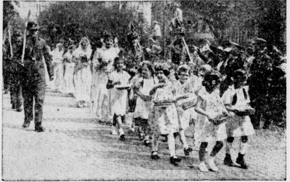
Maien-Kameradschaft-Hochzeit beim Arbeitsdienst. Ein reizendes Bild aus Heidelberg; den Brautzug eröffnen Kinder, Kameraden vom Arbeitsdienst begleiten die Brautpaare mit geschultertem Spaten.