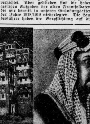
Der Entscheidungskapf in Arabien. Fahrt ins Ost-Semester: 1000 Judenten und Studentinnen traten am Sonntag von Berlin die Reise nach Königsberg an, wo sie an der Hochschule ihr Studium fortsetzen wollen.

Das neue Gelübnis des NSDFB: Gelobet ihr Kameraden vom NSDFB, (Stahlhelm) als Kämpfer der nationalsozialistischen Idee und Bewegung im Kampf für deutsche Ehre und Recht, für deutsche Freiheit und Volksrechte dem Reichspräsidenten, dem Obersten Führer Adolf Hitler, dem Bundesführer und den von ihm eingesetzten Führern des Bundes Gesetzhaltigkeit auch in Not und Tod... So spricht: „Wir geloben es!“