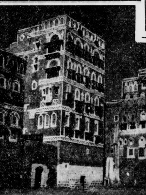
Staatsgebäude in Sanaa, der Hauptstadt von Jemen. Der Kampf um Sanaa wird über das Sckickal des Jemenstatts entscheiden.

Das neue Gelübnis des NSDFB: Gelobet ihr Kameraden vom NSDFB, (Stahlhelm) als Kämpfer der nationalsozialistischen Idee und Bewegung im Kampf für deutsche Ehre und Recht, für deutsche Freiheit und Volksrechte dem Reichspräsidenten, dem Obersten Führer Adolf Hitler, dem Bundesführer und den von ihm eingesetzten Führern des Bundes Gesetzhaltigkeit auch in Not und Tod... So spricht: „Wir geloben es!“