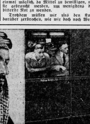
Fahrt ins Ost-Semester: 1000 Judenten und Studentinnen traten am Sonntag von Berlin die Reise nach Königsberg an, wo sie an der Hochschule ihr Studium fortsetzen wollen.

finden, unsere Frontkameraden von Stahlhelmen in dieser schweren Zeit an der Spitze seiner Leistungsfähigkeit ankommen und wollen wir selbst von unserem Bunde aus ihm helfen.