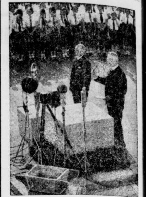
Grundsteinlegung zum Reichsbank-Neubau. Reichsbankpräsident Dr. Hjalmar Schacht bei der Weihe des Grundsteins mit drei Hammerschlägen.

neuen Leitfaden des NSDFB (Stahlhelm) übernommen. Ich fordere Euch alle, meine Kameraden, auf, die neue Treueformel zu beschwören. Das neue Gelübnis des NSDFB: Gelobet ihr Kameraden vom NSDFB, (Stahlhelm) als Kämpfer der nationalsozialistischen Idee und Bewegung im Kampf für deutsche Ehre und Recht, für deutsche Freiheit und Volksrechte dem Reichspräsidenten, dem Obersten Führer Adolf Hitler, dem Bundesführer und den von ihm eingesetzten Führern des Bundes Gesetzhaltigkeit auch in Not und Tod... So spricht: „Wir geloben es!“