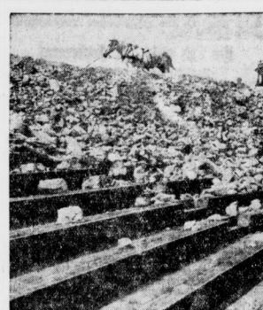
Die Umgestaltung des Deutschen Stadions. Blick auf die Westkurve im Deutschen Stadion...