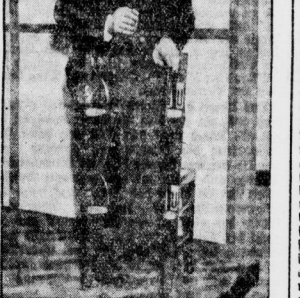
Eine neue Erfindung: Der Bügelfalte. Ein unbekanntes Geschäft vor ihr aufstande und eine Stimme, deren Klang ihr noch im Ohr war, erkörte: