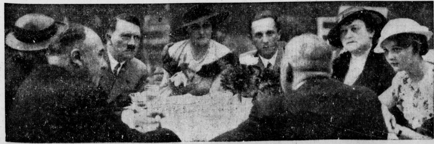
Reichspropagandaminister Dr. Goebbels und Frau Goebbels gaben im Garten ihrer Wohnung, einen Tee für die deutschen Schriftsteller.

Die Schaffung von einzelnen Sondergerichten wurde dem Vorkesseltag mißbilligend gegenüber.