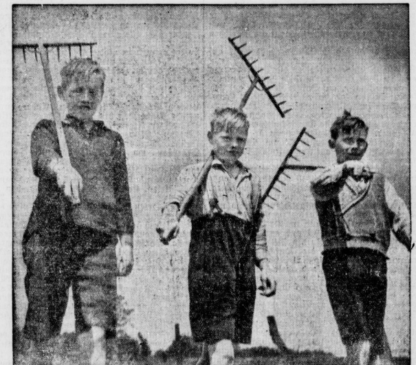
Stadtfinder wollen aufs Land Helft dem Hilfswerk „Mutter und Kind“ und spendet für die Verpflegung von Stadtfindern aufs Land!

In dem Londoner Cridet-Museum befindet sich ein Schloß, der als der älteste der Welt gilt. Er wurde im Jahre 1750 hergestellt und aus einem einen Stück Holz gefastet. Dieses alte Schloß wurde im Jahre 1890 gefunden, als man ein altes Londoner Haus abriß. Ein anderer Schloß ist dadurch merkwürdig, daß er 15 Jahre lang auf dem Scheitelpunkt eines Hauses in Australien stehen hat.