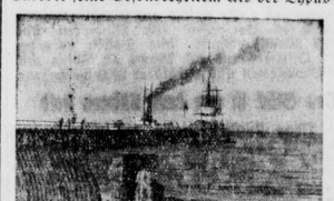
Am Landungssteg in Bollenhagen.

Die Ostsee hat vor der Nordsee den Nachteil voraus, der zur Mäßigung einer zu starken Fußbewegung wichtig ist. Abgesehen von diesen zwei großen Gruppen hat fast jeder Badeort seine Besonderheiten. Als der Typus