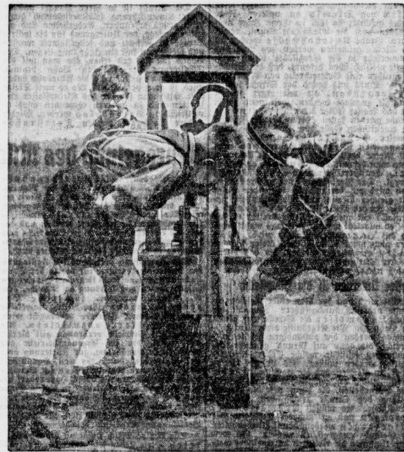
Wenn einer Durst hat, muß der andere pumpen.

Derbert atmete schwer. Dann war es wieder ganz still, nur noch ist das Ferkeln und Donnern eines Wasserfalls vernäherbar. Es ist wahr — beinahe sechs Stunden sind es her, daß wir den letzten Menschen