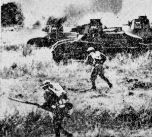
Moderne Kriegstechnik bei Manövern in den Vereinigten Staaten.

Die russische Armee, die im letzten Frühjahr von Schwarzem Meer nach Madagaskar überführt sind, sollen mit ihrem