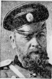
Se. hohe Exzellenz General Samsonow.

Im Ausland fehlte das Mitleiden am großen Trügerischen Geschehen. Obgleich Ostpreußen der Petersburg zunächst gelungene Kriegsschauplatz war, erlitt selbst die Bevölkerung der Hauptstadt erst am 1. September Kunde von der Schlacht an den Masurischen Seen. Denn erst am Abend des 31. August traf die schlimmste Mitteilung des Hochkommandierenden Nikolai Nikolajewitsch in den Redaktionen ein; sie meldete in verdächtigem Form die Vernehmung zweier russischer Corps und den Tod der Generale Samsonow,