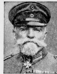
Generaloberst Frhr. v. Falkenhause 90jährig. Am 13. September begeht in Görtz in Generaloberst Ludwig Frhr. v. Falkenhause in großer geistiger Frische seinen 90. Geburtstag. Generaloberst v. Falkenhause hatte die erfolgreiche Abwehrschlacht gegen die einfallenden Franzosen in Lothringen im Jahre 1914 geleitet. Im Jahre 1917 wurde er als Nachfolger des verstorbenen Frhr. v. Bissing Generalgouverneur von Belgien. Er ist Ritter höchster Orden.

Frankreichs neueste großartige Kriegsvorbereitung. Seit Jahren schon herrscht in Frankreich das Vertrauen, daß ein beträchtlicher Vorrat von Benzin und Kohöl auf Lager zu haben, da das Land über ein eigenes Petroleumproduktions- und daher nicht auf die Einfuhr aus anderen Ländern angewiesen ist. Dieser Betrag der Lagerverrat durchschnitlich