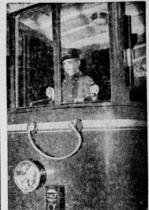
Abwink- und Haltezeichen für Straßenbahnen.