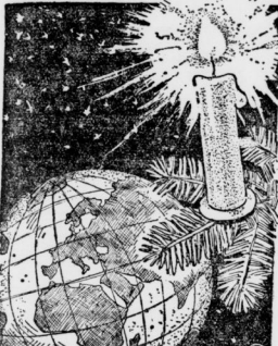
Die 200-Meter-Welle ist in diesem Saal unter der Leitung von Herrn Direktor Dr. G. B. ...