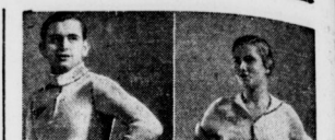
Der neue Anzug für die deutschen Sportler.

Am Sonntag wurde auf Anregung des Deutschen Rad- und Sportfestes zwischen diesem und dem Deutschen Schützenbund ein Mannschaf Wettkampftage ausgetragen. Die Kämpfe fanden in der Kreisstadt Magdeburg, Halle (Saale) und Halle (Z) statt. Die Wettkämpfe wurden von ca. 1500 Mann besucht. Die Teilnehmer waren sehr zahlreich.