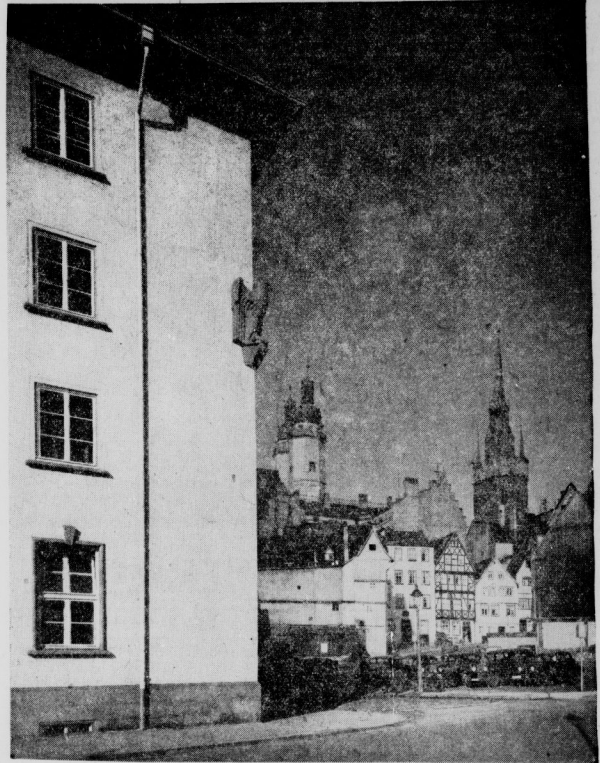
Inmitten alter, spitzgiebiger Häuser steht der schmucke Behördenneubau.

Dem Eingang gegenüber befindet sich die Kassenhalle, die hell und licht ist. Immerhin muß man sich erst an die Eisenkassensäulen und an die aus dem gleichen