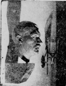
Die Führerbüste in der Eingangshalle.

Mitteldeutschlands Bevölkerung wurde ein neues Behördenhaus übergeben