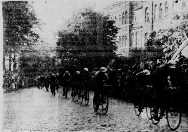
Zehntausende umsäumen gestern nachmittag die Straßen unserer Stadt, um die Durchfahrt der „Giganten der Landstraße“ zu erleben, die von Hannover nach Leipzig die vorletzte Tagesetappe des 5000 Kilometer langen Rennens durch alle großdeutschen Gauen fuhren. Unser Bild zeigt die Fahrer auf dem Universitätsring. (Wir berichten über die Durchfahrt im Sportteil der vorliegenden Ausgabe ausführlich.)