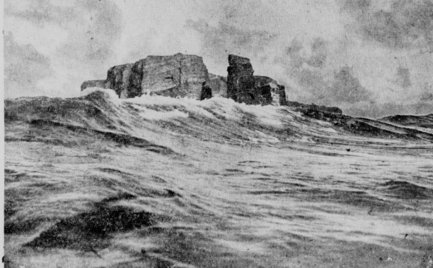
Das Felsenland in der Nordsee.

Wir fahren und schauen. Bis wir schließlich, mitten in dem bunten Bilderbuch der deutschen Bucht, die ragenden Felsen