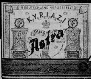
Mit und ohne Mdstk.