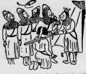
„Ihr irt, Majestät! Zum Ritterschlag müßt Ihr die Klinge flach halten!“

Anna atmete auf. Aber nur innerlich. Außerlich schloß sie. Wo Frig ihn doch so schön gemacht hat! Den darfst du Frig nie — sie zeigen!