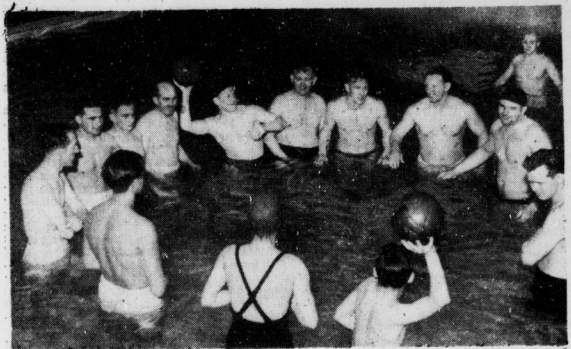
Wittm. - Schulte

berum! Zwei bilden eine Brücke mit der Armen, und ein Dritter springt zwischen ihnen. Eins, zwei, drei, eins, zwei, drei — tönt ihr Kommando.