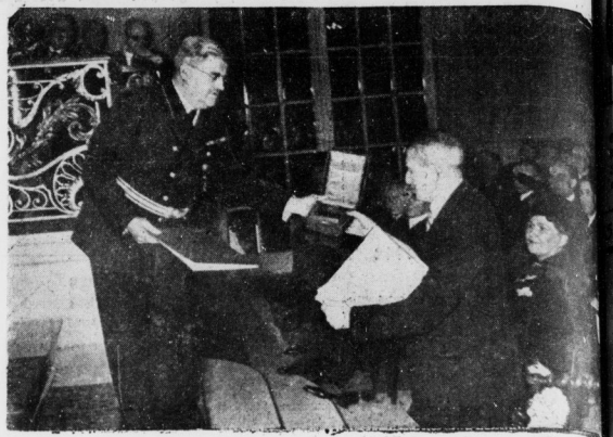
Adlerschild für Gouverneur a. D. Dr. Heinrich Schnee... Unser Bild: Der Chef der Präsidialkanzlei, Staatsminister Dr. Meißner, überreicht...