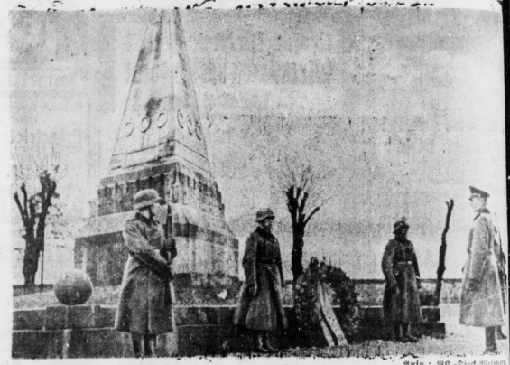
Die Wehrmacht ehrt das Andenken der Kämpfer vor sieben Jahren... Ein Oberst legt am Gräberdenkmal auf dem Hauptfriedhof in Dijon zur Ehren der...