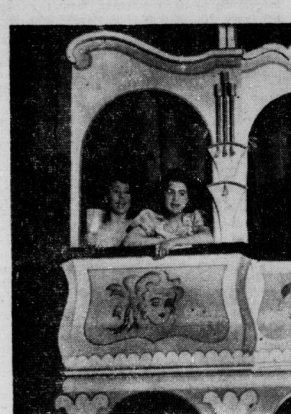
Ein hübscher Einfall als Auftakt: Die Künstler haben den Spieß umgedreht und beobachten von ihrer Loge aus das Publikum