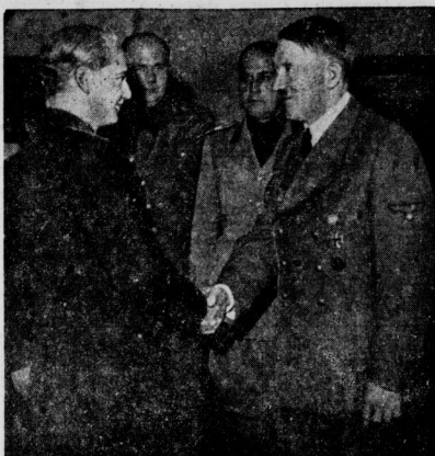
Suner und Graf Ciano beim Führer

Der spanische Minister des Aeußeren, Serrano Suner, und der Königlich Italienische Minister des Aeußeren, Graf Ciano, beim Führer... Prof. Hoffmann (20)