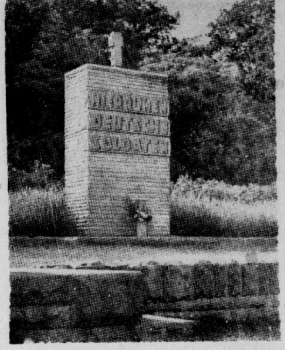
Deutsches Ehrenmal Buch bei Metz Aufst. aus dem Erdboden des Volkstundes Deutsche Kriegsgedenkstiftung

den im Westen die Ehrenfriedhöfe, in denen die Toten ruhestatt wurden.