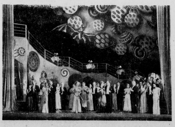
Unser Bild gibt einen Ausschnitt aus der ganz entzückenden und sehr beschwingten Auf- führung der „Fledermaus“ am hallischen Stadttheater, die lebhaften Beifall fand