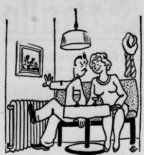
„Durch deine Unpünktlichkeit habe ich direkt Eisbeine bekommen“