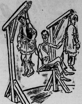
Anthony Eden: „Die Verbindung zwischen Ägypten und Griechenland ist hergestellt!“