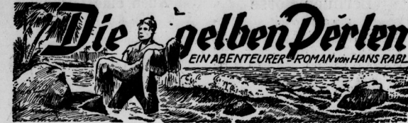
EIN ABENTURER-ROMAN von HANS RABL

Kopierrecht by Verlag Roeser & Hirth, München 1940