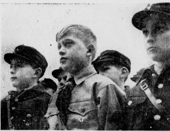
Die ersten Zehnährigen beim ersten Dienst. Sie geben sich alle Mühe, um es den älteren Kameraden gleichzutun.