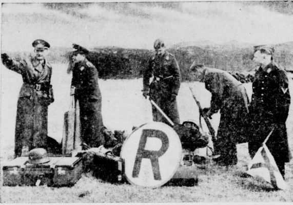
FR. Reinhold-Beitbild (BR.)

Seeben sind deutsche Fliegerverbände auf dem Militärflugplatz von Stavanger gelandet. Das Bodenpersonal ist sofort darangegangen, einen ordnungsmäßigen Flugbetrieb einzurichten. Im Vordergrund sieht man die provisorische Flugleitung