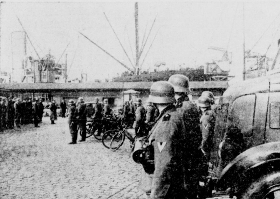
FR. Hage-Beitbild (BR.)

Einzug deutscher motorisierter Truppen in dem dänischen Städtchen Horsens