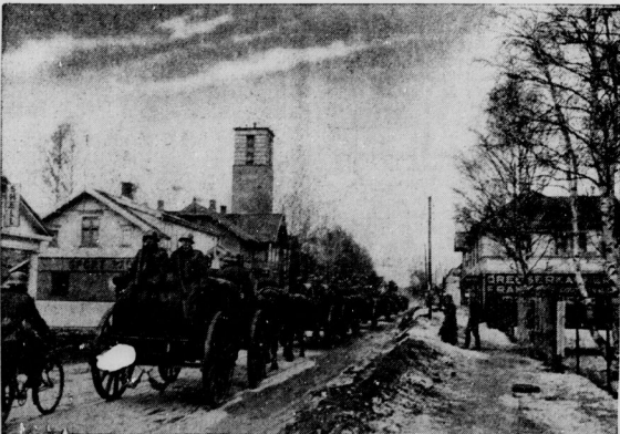
FR. Hage-Beitbild (BR.)

Truppenlandung im Hafen von Oslo. Als erste ist eine Radfahrerschwadron im Hafen der norwegischen Hauptstadt ausgeschifft worden