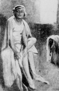
G. S. von Sallwürdt: Die Tänzerin Unsere Aufnahme stammt aus der Ausstellung des Künstlers in der Künstlerhaus des „Künstlervereins auf dem Pillig“ im Roten Turm

Der Verbräute besteht, erhält ein Zeugnis. Auf Grund dieses Zeugnisses wird den Hausfrauen durch Urkunde des Deutschen Frauenwerkes die Ehrenbezeichnung „Meisterhausfrau“ verliehen. Bisher haben rund 2000 Hausfrauen diesen Titel erhalten können. Weitere rund 1700 befinden sich augenblicklich in den Kurven. Das Ziel dieser Arbeit ist es nicht nur, die einzelne Hausfrau zur Meisterin für ihren Haushalt und ihre Familie zu führen, sondern sie auch als Zahlverbräute für wichtige Aufgaben in im großen Volksdienst zu gewinnen.