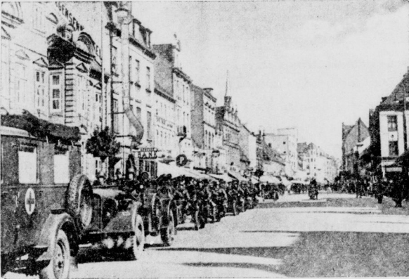
FR. Holtenberg-Beitbild (BR.)

Seeben sind deutsche Fliegerverbände auf dem Militärflugplatz von Stavanger gelandet. Das Bodenpersonal ist sofort darangegangen, einen ordnungsmäßigen Flugbetrieb einzurichten. Im Vordergrund sieht man die provisorische Flugleitung