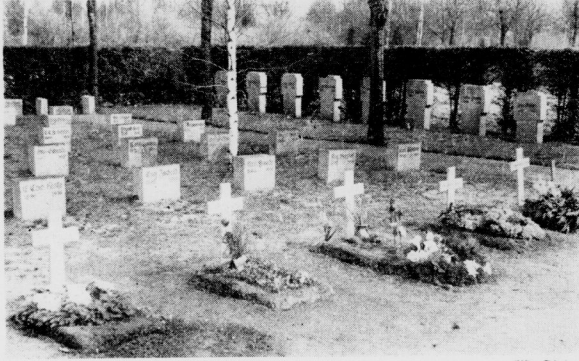
Die Gräber der 16 im Reservelazarett gestorbenen Polenkämpfer

In gleichmäßiger gerade ausgerichtetem Reihen, einfach und grau wie ein Trupp von Soldaten selbst stehen die Gedenksteine der Gefallenen des Weltkrieges. Vier große Felder auf dem südlichen Teil des Gartensriedhofes verzeichnen ihren Namen. Die Steine wirken schon wie Ehrensteine, sind dem ersten Kreis der Bevölkerung einwidmet. Aber am Baum der beiden kleineren Felder sind frische Gräbermalen angebracht. Braune Holzkreuze stehen darauf, und Blumen in diesen Kränzen und Kränzen decken die Erde. 16 Soldaten die aus dem Reservelazarett im Reservelazarett oder krank heimkehrten und im Reservelazarett in Halle gestorben sind, ruhen darunter. Später werden sich ihre Gedenksteine einziehen in die Zeit der anderen, nur der darüber wird von den alten abgeben, vielleicht wird man die neuen Tafeln aus rötlichem Gestein bauen.