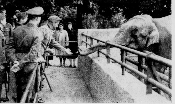
Junge Freundschaft